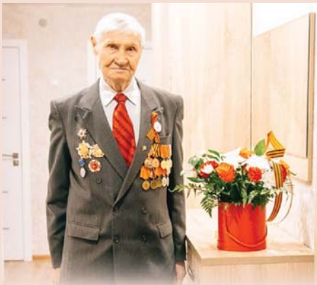
Нововоронежские атомщики поздравили ветеранов Великой Победы на дому

ФГУП «НИИ НПО «Луч» выпустило второе издание Книги Памяти. На предприятии в разное время работали свыше 600 участников ВОВ, о 227 фронтовиках-средмашевцах рассказывает книга «Бессмертный полк Луча». Память о поколении, которое