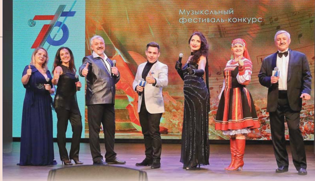
Вокальная эстафета «Росэнергоатома» в Десногорске

Атомщики продолжали рисовать, фотографировать, танцевать, петь, мастерить. Полсотни членов профсоюза из Лесного приняли участие в конкурсе защитных масок с профсо-