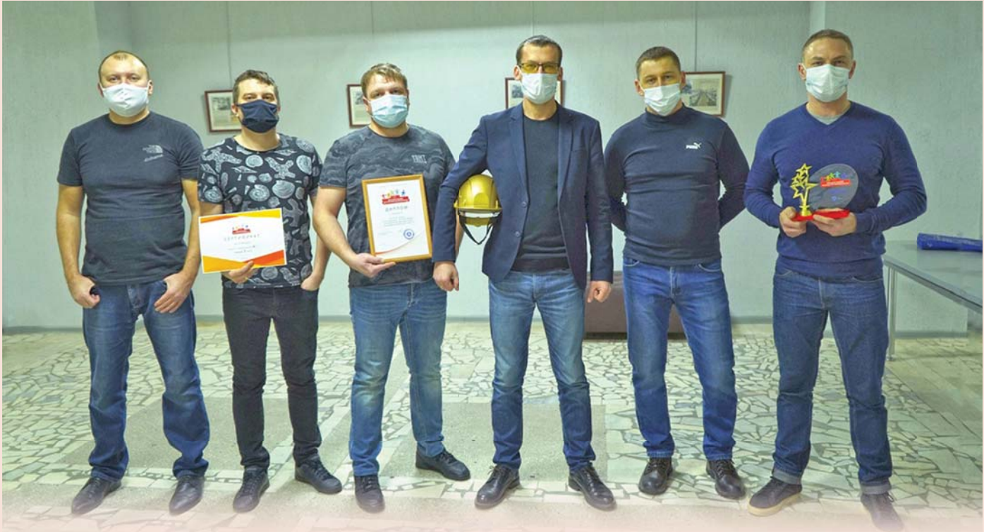
Команда победителей Марафона знаний по культуре безопасности

В ПО «Старт» наградили участников первых соревнований по безопасности и охране труда