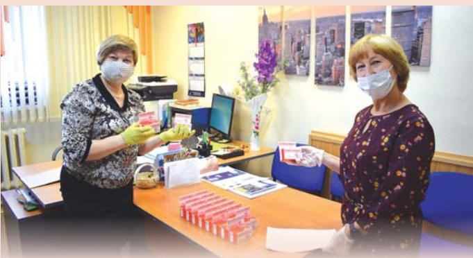
Профорганизация ЭХП поддерживает работников витаминами

Профорганизации поддерживали переболевших коронавирусной инфекцией материально. В Сарове матпомощью ППО РФЯЦ-ВНИИЭФ в размере 5 тысяч рублей воспользовались тысячи атомщиков. Такое же решение принял президиум ППО ПО «Маяк», но на выплату в пять тысяч рублей могли рассчитывать ➔