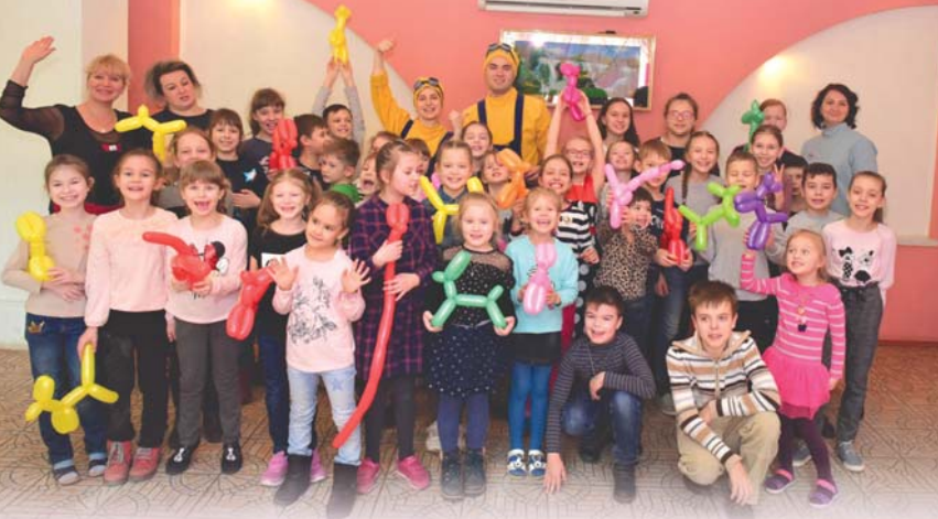
Участники экскурсии выходного дня для детей работников КуАЭС