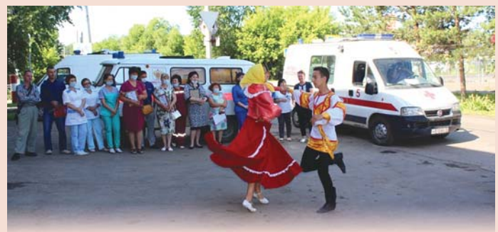
С Днем медицинского работника коллектив димитровградской клинической больницы № 172 ФМБА России поздравили концертом на открытом воздухе