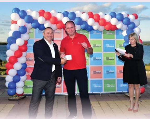
24 работника КуАЭС получили знаки ВФСК ГТО по итогам 2019 года