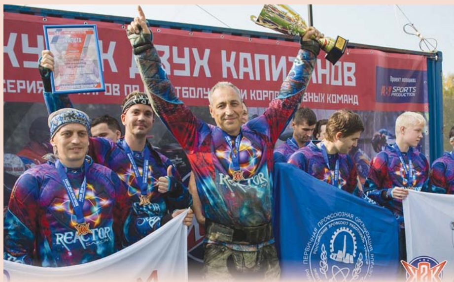
Атомщики из Сарова заняли первое место в соревнованиях по пейнтболу «Кубок двух капитанов»