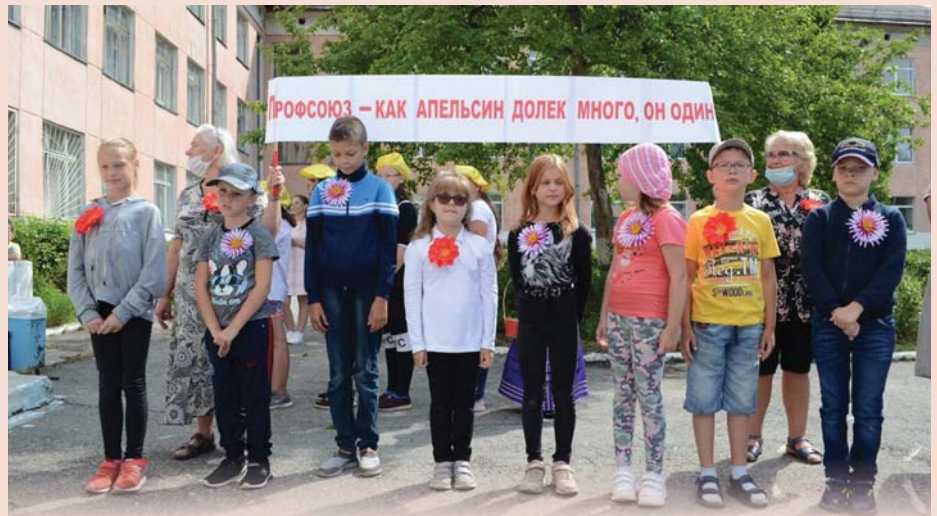
Профсоюзная лагерная смена в Снежинске

лайн-проект лагеря «Дружба» профорганизации НВАЭС «3D – Дружба! Драйв! Движение!».