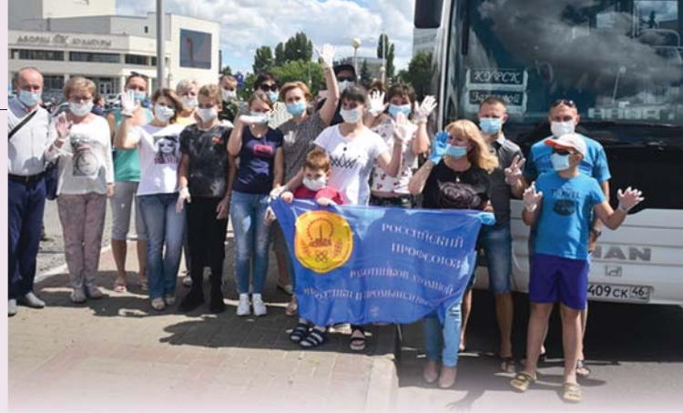
Первые профсоюзные туристы Курской АЭС отправились в Геленджик