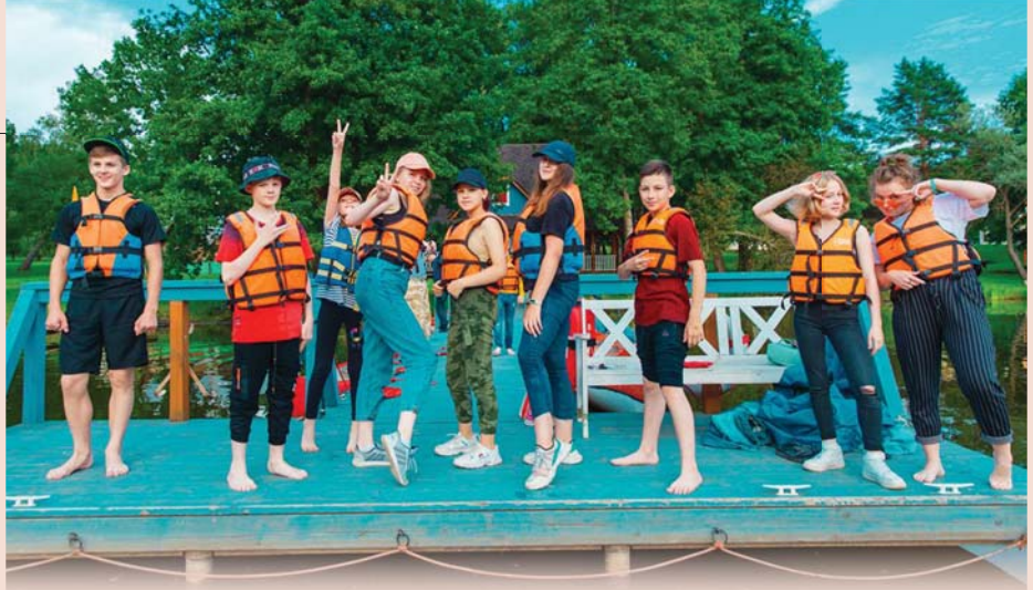
Дети атомщиков из Билибино надолго запомнят летний отдых – для них поездка в Калужскую область стала настоящим событием

Вывести детей в настоящие лагеря получилось не у всех, некоторым пришлось организовывать виртуальные смены. Так, среди детей Нововоронежа пользовался популярностью он-